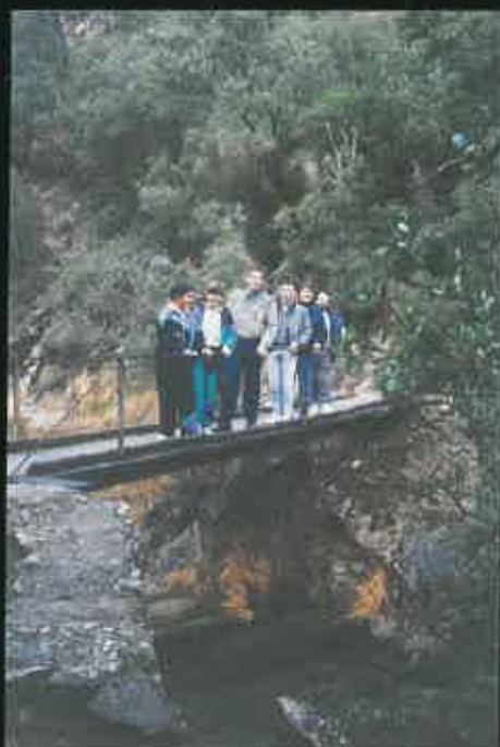
Actividades culturales y de ocio.