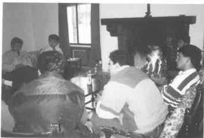
Miembros de Juntas de Gobierno durante las jornadas en Torrealba.