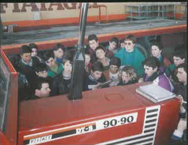
De Visita de Estudio a una casa de maquinaria agrícola.