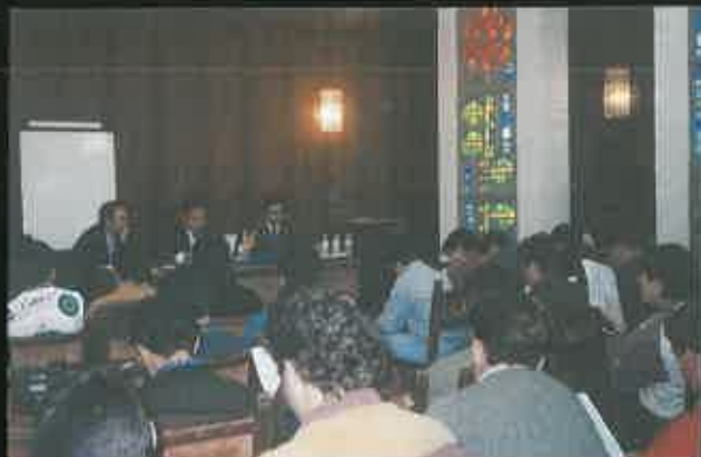
Conferencia del Dtor. Provincial del M.º de Agricultura.