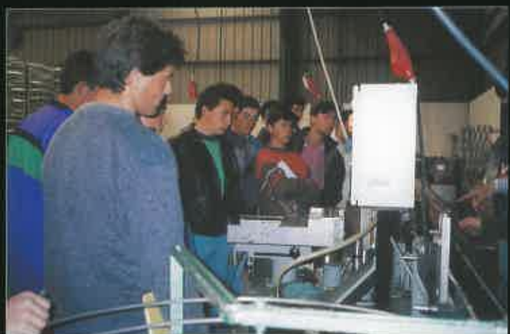
Durante una Visita de Estudio a una conservera.