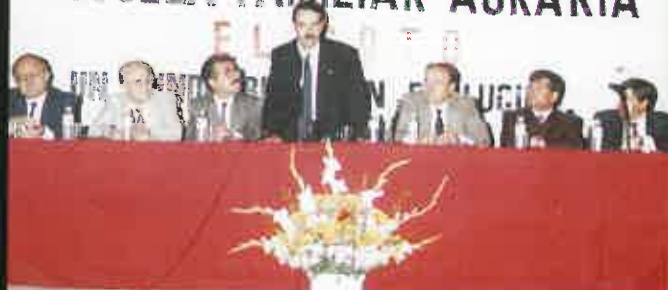
El Presidente de la Caja intervino en la XII Asamblea.