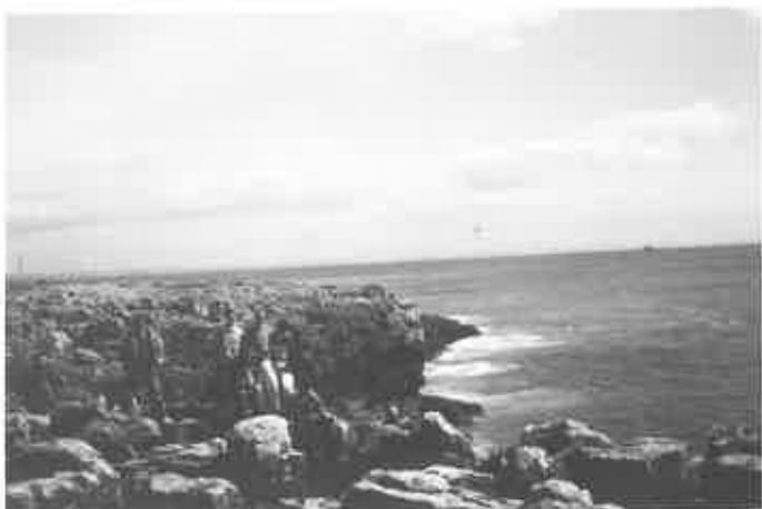
Paseo por el litoral portugués.

El conjunto de trabajos de análisis y reflexión