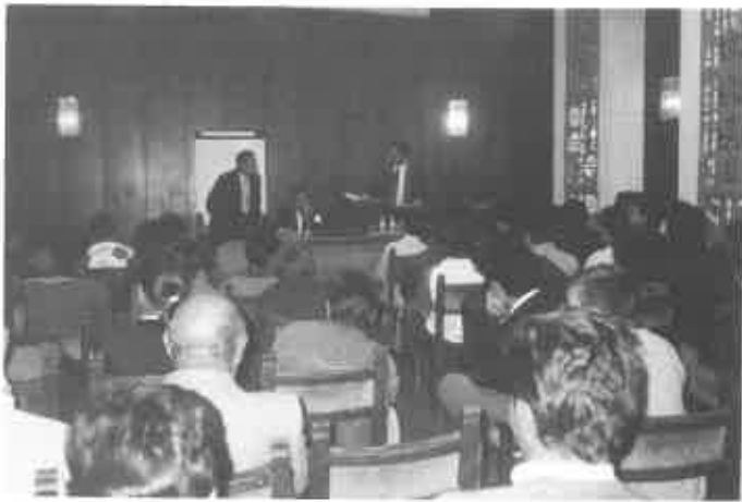
Conferencia sobre la reforma de la PAC.