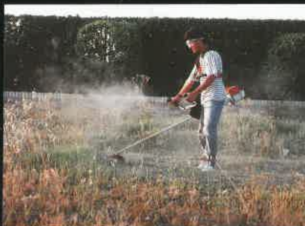
Durante las prácticas de un curso de Jardinería.