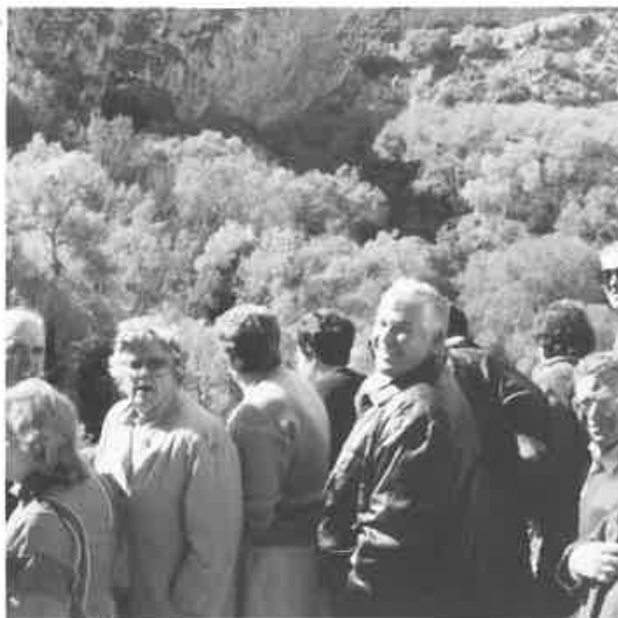
Participantes en la Jornada Mariana de la familia, en su visita al paraje natural de Monasterio de Piedra.