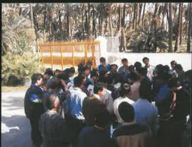
De intercambio escolar en Alicante.