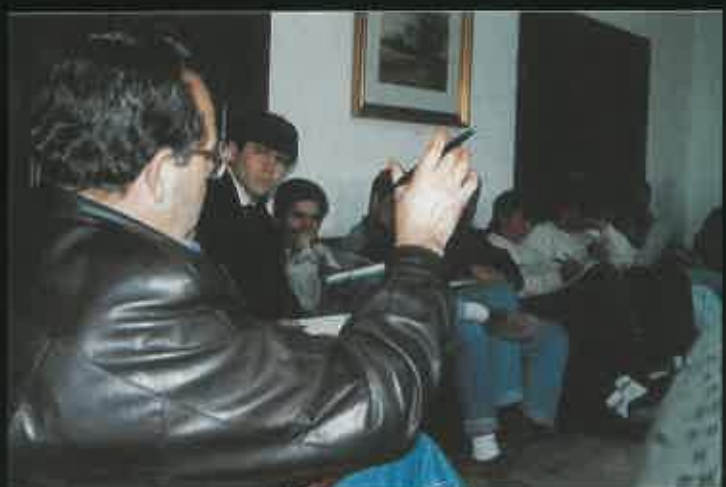
Charla-coloquio con el Presidente de la cooperativa CESURCA.