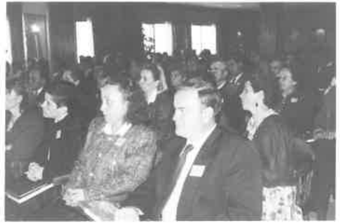
La participación de familias es esencial en la EFA.

Las familias que componen este Grupo de Tra-