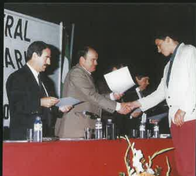
Entrega de títulos a las promociones que acaban.