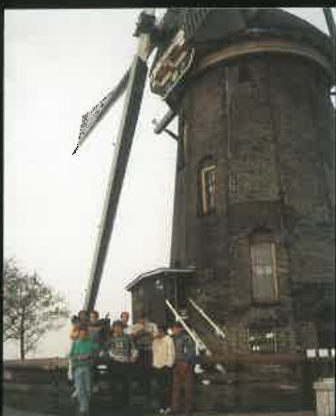
Durante el viaje por los Países Bajos.