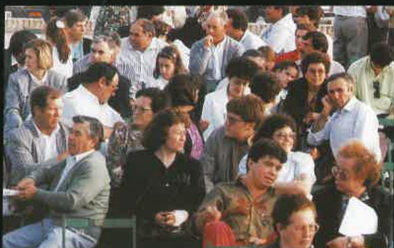
Las familias del medio rural, eje de la Asociación.