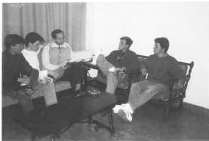
Antiguos alumnos de la Sección Juvenil.