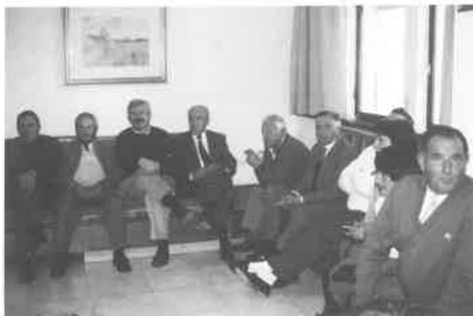
Encuentro de familias en la EFA.

En estos cursos de Primer Grado se han ido