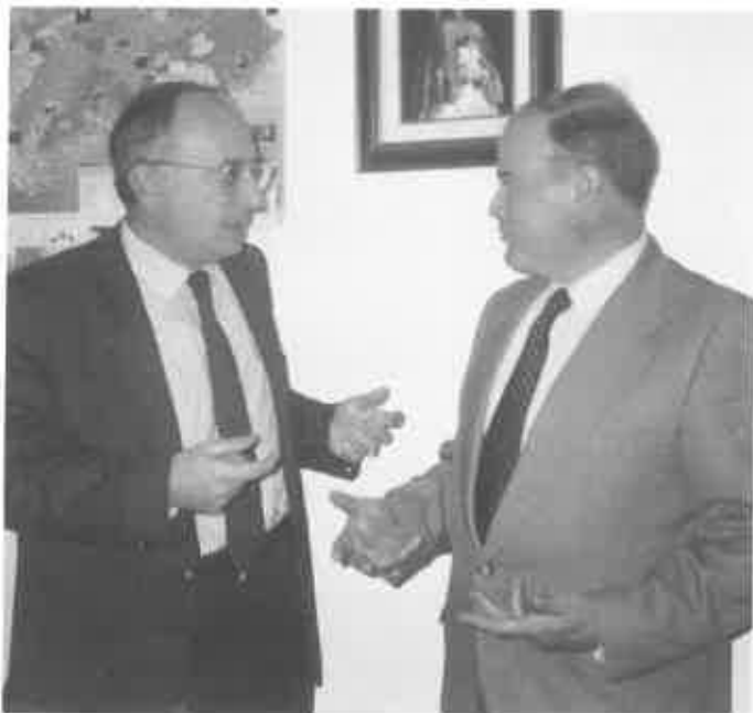
Representantes de UNEFA y la Asociación.