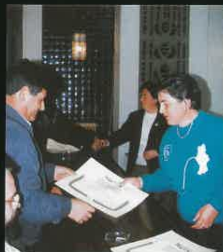
Entrega de Diplomas tras un curso de Formación Permanente.