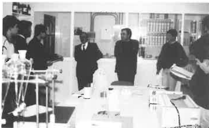
Alumnos de 5.º visitan una cooperativa en Antequera.