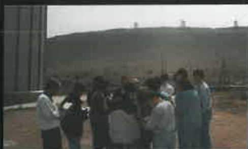
Durante el intercambio escolar en la Mancha.