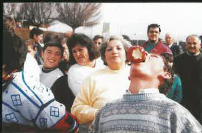
Fiesta de Familias de Navidad.