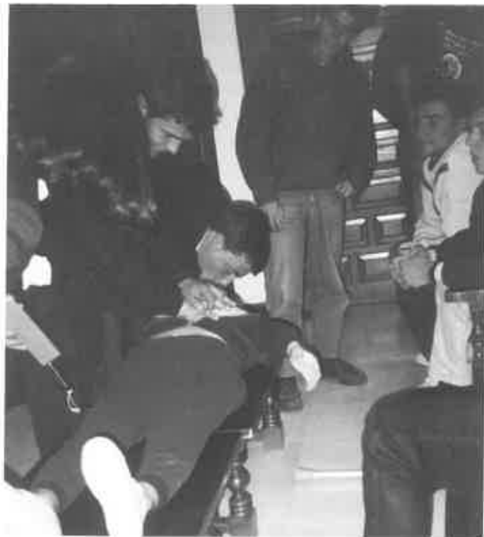
Prácticas de Seguridad e Higiene.

Fue realizado por los alumnos de Segundo que pudieron conocer la realidad agropecuaria de una