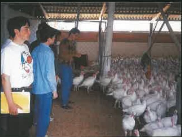
Durante el intercambio en Portugal.