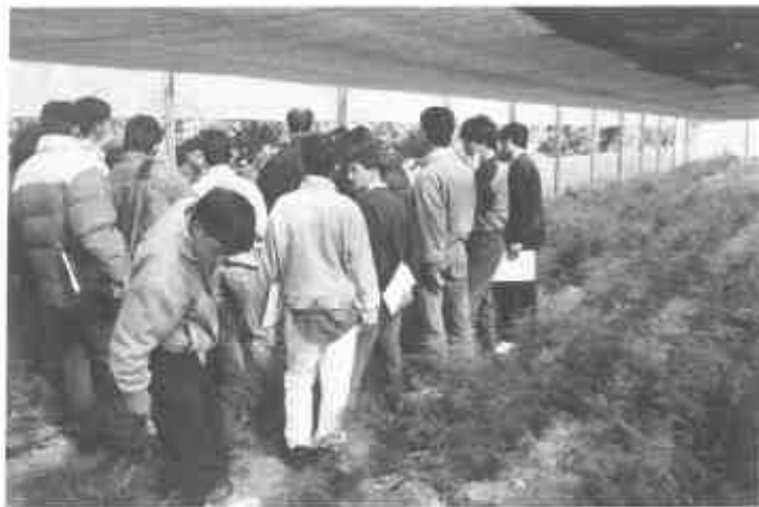
Alumnos durante una visita de estudio en Portugal.

las características de las empresas, la vida local, etc. Este trabajo es el punto de partida en el que se apoya todo el Plan de Formación de la EFA.