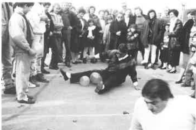
Juegos para todos en la fiesta de Navidad.