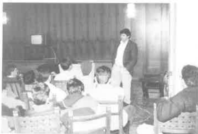
Tertulia cultural sobre la taxidermia.