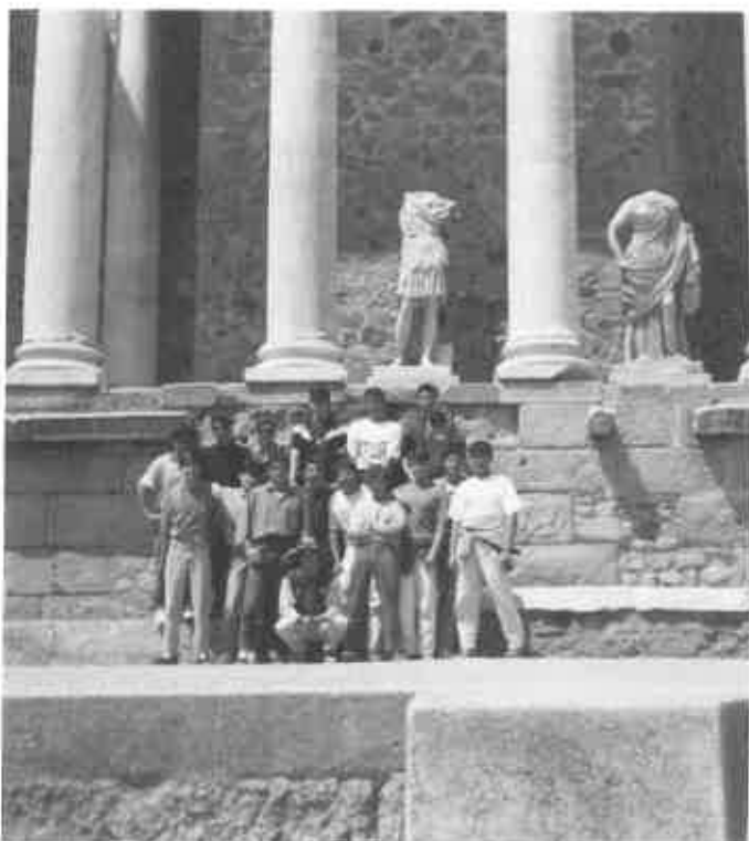
Durante un intercambio, en el teatro romano de Mérida.

Un grupo de alumnos de Quinto realizaron un viaje por los Países Bajos, durante en el que a lo largo de dos semanas visitaron un gran número de