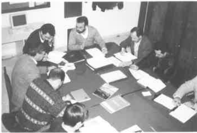
El equipo de monitores en Sesión de Trabajo.