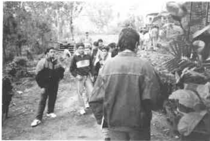
De visita de estudio en Láchar.